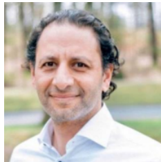
Happy Megally Secretaris